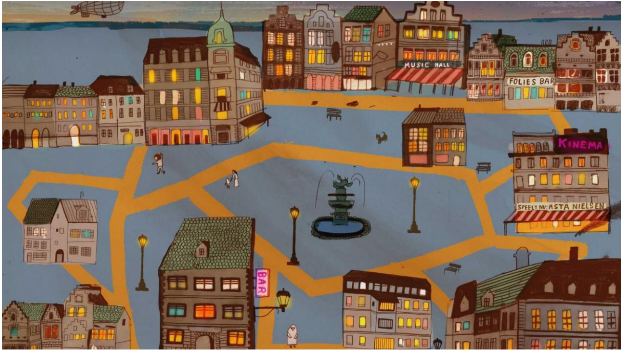
Detail uit Besmette Stad © Dieter de Schutter

Mens en cultuur zijn deze dagen goeddeels naar het internet verhuisd. In het multimediale project Besmette Stad van DeBuren geeft een keur aan Vlaamse en Nederlandse kunstenaars een artistiek antwoord op de coronacrisis.