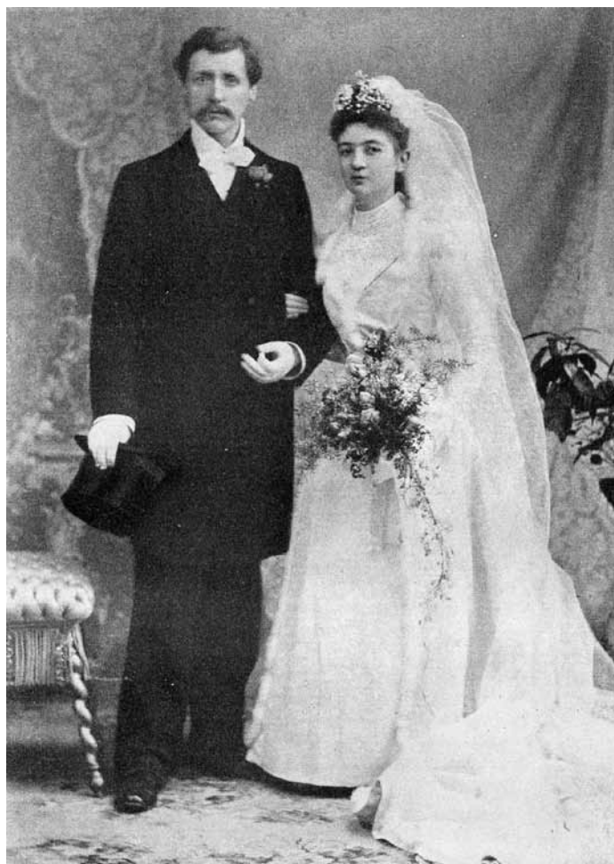
Bruidspaar, 4 januari 1900. Uit: J. Kloos-Reyneke van Stuwe, Het menselijke beeld van Willem Kloos. Lochem, 1947.

Hartstocht verscheen in de verlovingsperiode van Jeanne Reyneke van Stuwe en Willem Kloos. Na een korte correspondentie kwam het tot een eerste ontmoeting begin april 1899. Tijdens dat samenzijn vroeg Kloos haar ten huwelijk en Reyneke van Stuwe stemde toe. Wegens uiteenlopende woonplaatsen – hij in Bussum, zij in Den Haag – ontstond een correspondentie. Binnen enkele maanden las de nieuwbakken verloofde hoe zijn aanstaande over zelfbeheersing van fysieke hartstocht dacht. Kloos kwam er herhaaldelijk op terug in zijn brieven, direct en indirect. Op 26 april 1899 schreef hij: ‘Ik ben heelemaal niet bruut of een geweldenaar, zooals zooveel mannen zijn, en waar jij, geloof ik, het land aan hebt, en toch ben ik sterk en inwendig-hartstochtelijk.’ 10 Daarna kwalificeerde hij zichzelf als ‘gevoeliger en teer-begrijpender dan de meeste mannen zijn’, waardoor hij juist goed bij haar paste. 11 Op 15 juni 1899 meende hij dat zij ‘een beetje antipathie tegen den omgang met een man’ bezat (vermoedelijk bedoelde Kloos daarmee een fysieke omgang) omdat de meeste mannen ‘betrekkelijk-grove potentaten’ waren. Hij stelde haar gerust met: ‘Maar nu ben ik door